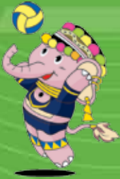
วอลเลย์บอลในร่ม

การแข่งขันกีฬานักเรียนองค์กรปกครองส่วนท้องถิ่นแห่งประเทศไทย รอบคัดเลือก ระดับภาคเหนือ ครั้งที่ 37 ประจำปีการศึกษา 2562