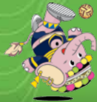
เซปักตะกร้อ