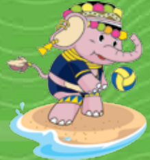
วอลเลย์บอลชายหาด