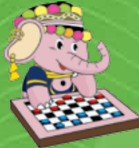
หมากฮอสไทย