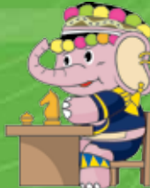
หมากรุกไทย