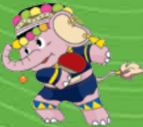
เทเบิลเทนนิส