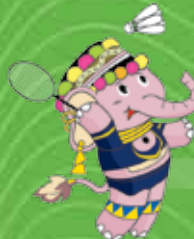
แบดมินตัน