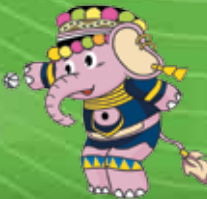
เปตองชู้ตติง